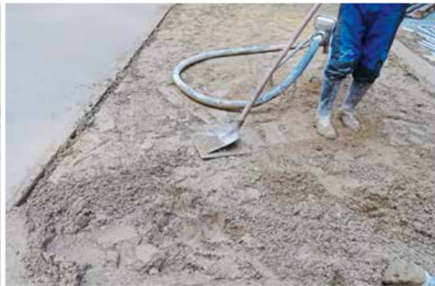
Der Estrichmörtel ist von beiden eingesetzten Estrichkolonnen zwischenverdichtet worden. Es kam entscheidend auf die hohe Qualität der Estrichverteilschicht an.

mörtel der Firma Thermotek erforderlich waren.