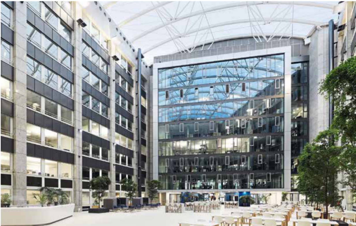
Ein in jeder Hinsicht gelungenes Werk u.a. der BGF+Architekten.

Am neuen Standort der Helaba im Offenbacher Main Park empfängt eine repräsentative Eingangshalle Mitarbeiter und Besucher. Die Umsetzung der fugenlosen Fußbodenkonstruktion entspricht formal nicht der DIN 18560, Teil 2. Der hohen Qualität der Leistungsumsetzung tut dies jedoch keinen Abbruch.