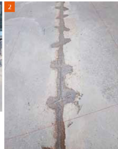
2 Die Arbeitsfugen wurden der Länge nach ca. 35 mm tief aufgeschnitten. Alle Fugen sind mit einem 2K-Epoxidharz kraftschlüssig beseitigt worden.