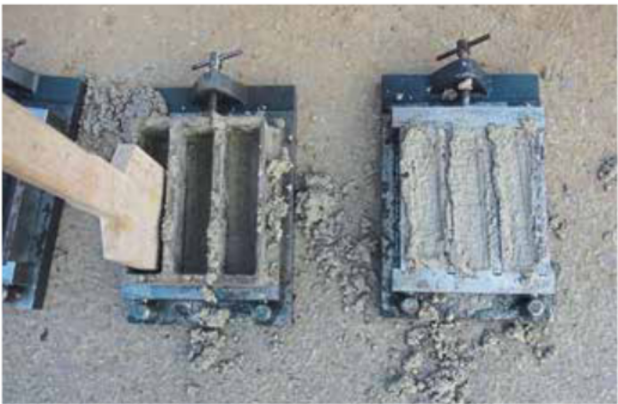
Die Biegezugfestigkeit des verwendeten Estrichmörtels wurde an den Mörtelprismen nach DIN EN 13892-2 mit 7 N/mm 2 erreicht.