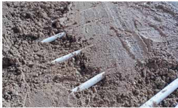
Der Estrichmörtel, hergestellt mit dem Bindemittel A58 der Ardex GmbH, ist in einer plastischen Konsistenz verarbeitet worden. In das Tragverhalten der Estrichlastverteilschicht wurden auch die Estrichbereiche zwischen den Heizrohren mit einbezogen.