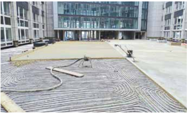
Innenfläche der Eingangshalle: Flächengröße ca. 1.400 m 2 , Fußbodenheizung. Bewegungsfugen in der Fläche werden nicht benötigt und wurden auch nicht ausgebildet. Die täglich entstandenen Arbeitsfugen sind zunächst als Pressfugen ausgebildet worden.